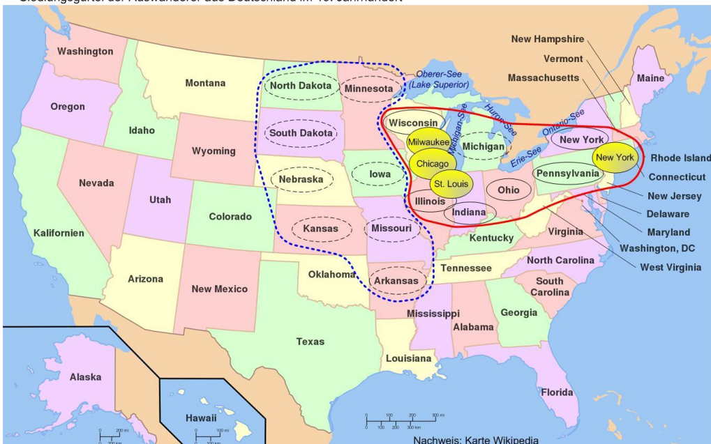
Siedlungsgürtel der Auswanderer aus Deutschland im 19. Jahrhundert

Nach der Ankunft der Auswanderer in den USA entstanden deutsche Viertel in den Großstädten wie New York, Chicago, Milwaukee und St. Louis.