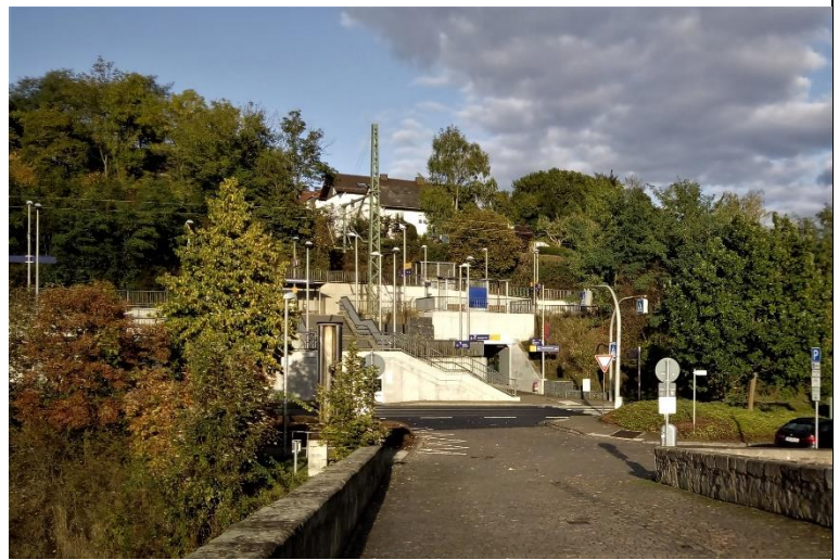
Ansicht von Stadtseite heute