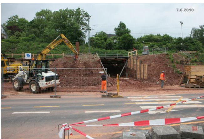
Schon deutlich sichtbar die neue Unterführung