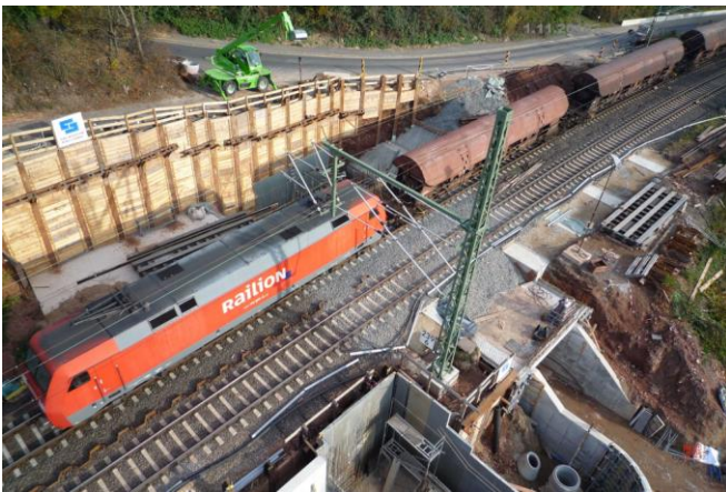
Die Belastungsprobe wird gemacht