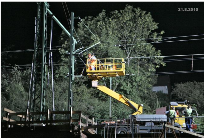
Strommasten werden neu gestellt und die Spundwände für den Bahnsteig zur HUBERG-Seite gesetzt