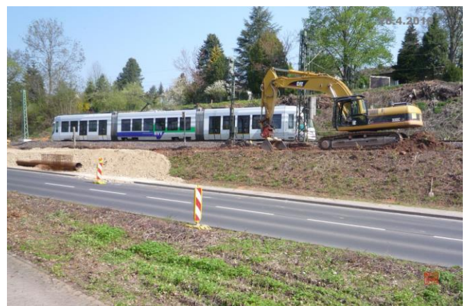
...und die Regio Tram