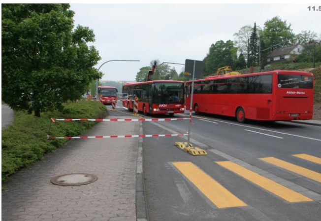
...dadurch wird's auf dem Schwarzenberger Weg eng