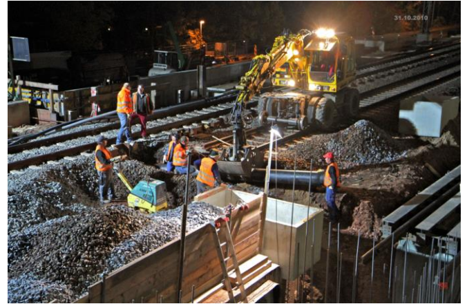
...und die Lasten ruhen jetzt auf der neuen Tunneldecke