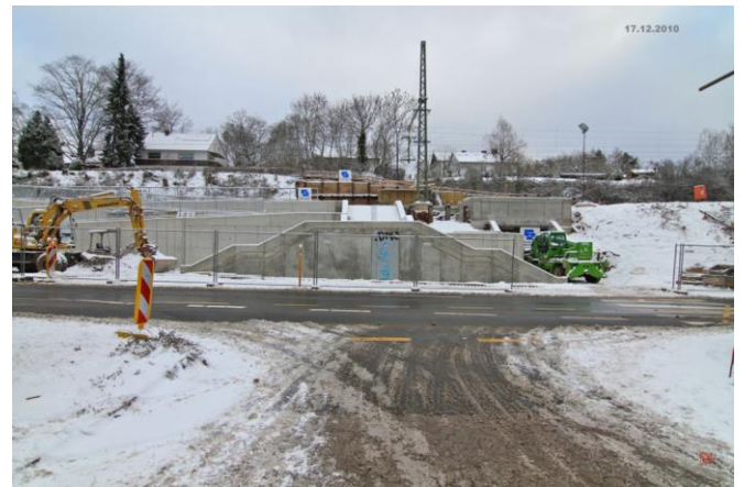
das sieht von der Stadtseite her so aus