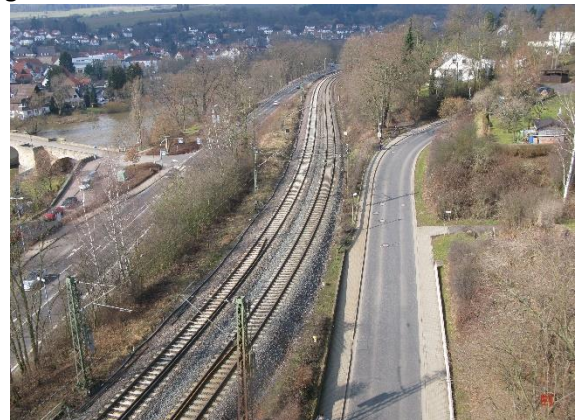
aber noch ist die Straße Huberg frei befahrbar