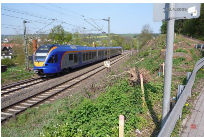
Der Cantus fährt...

Der Startschuss zum Baubeginn ist gefallen