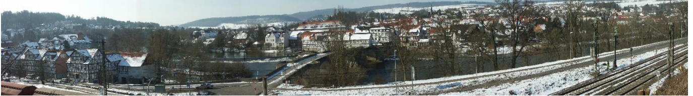
Panoramaansicht vor dem Bau

Till Krapp hat sich der mühevollen Aufgabe unterzogen und die Baustelle im Bereich der Haltestelle von der Freilegung von der Böschungsbepflanzungen bis zur Fertigstellung mit entsprechenden Bildern von der Baustelle und dem Baukran aus zu begleiten. Die Zusammenfassung ist in dem nachstehenden Aufnahmematerial von 2011 dargestellt.