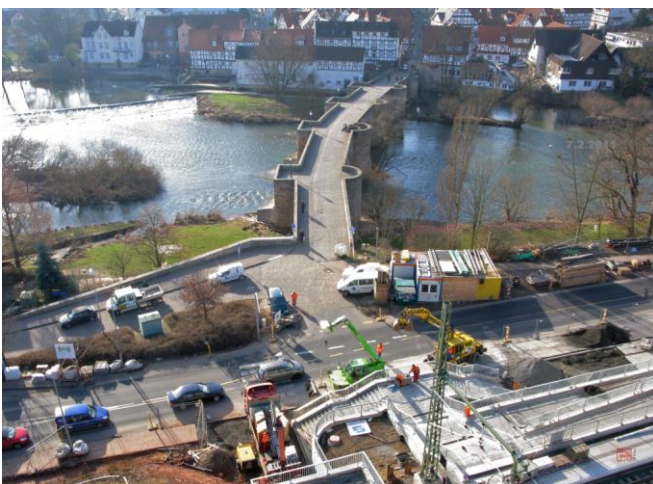
Ein Blick vom Kran auf die neue Haltestelle, der Bartenwetzterbrücke und auf die Regio Tram