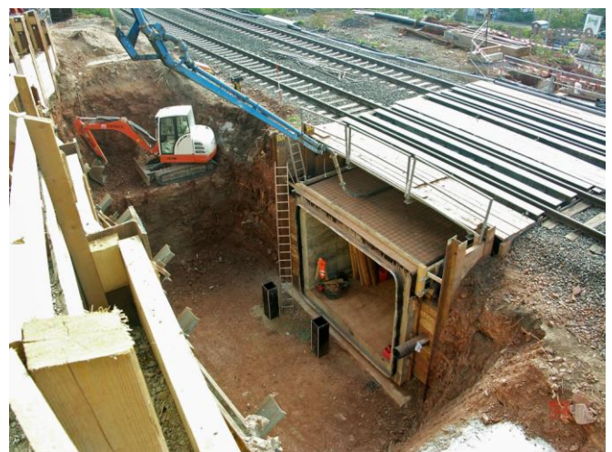
Die Tunnelstückstücke sind gesetzt