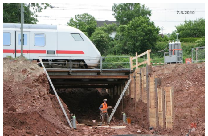
...bei weiterlaufendem Schienenverkehr