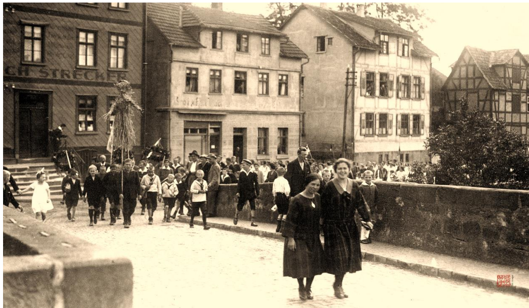
Umzug zum Heimatfest 1928

Der Startschuss zum Baubeginn ist gefallen