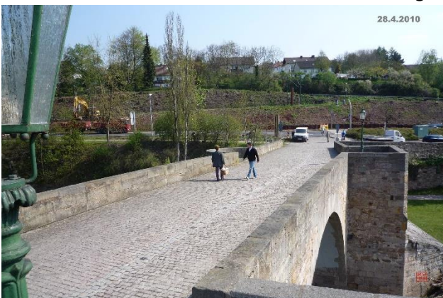
Die Baumaschinen rücken an