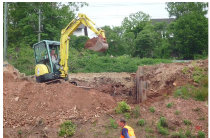
und der Durchstich für die Unterführung beginnt