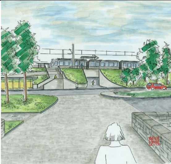
Planungsansicht von der Stadtseite (DB)