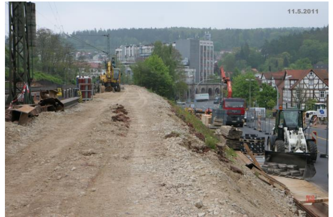
...aber nun ist es ernst, die Bauarbeiten laufen voll an