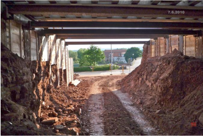
Das Wichtigste ist geschafft (Blick von unten)