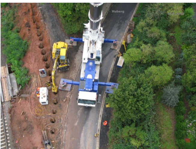
Die Spundwände... Ein Blick vom Kran...