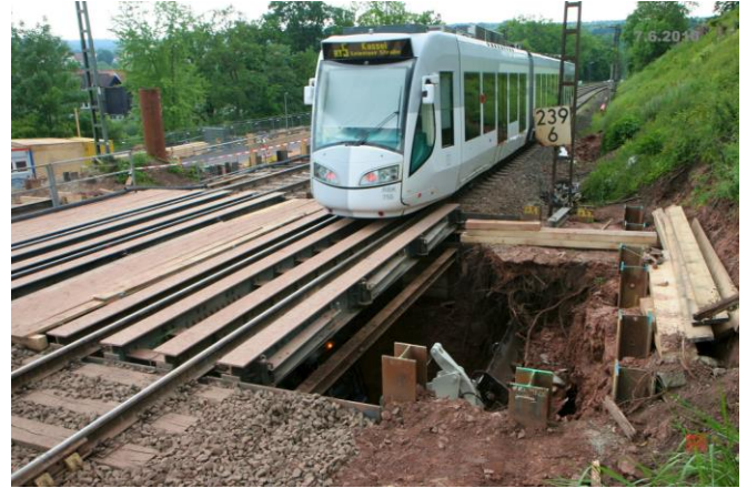
...und der Blick von oben