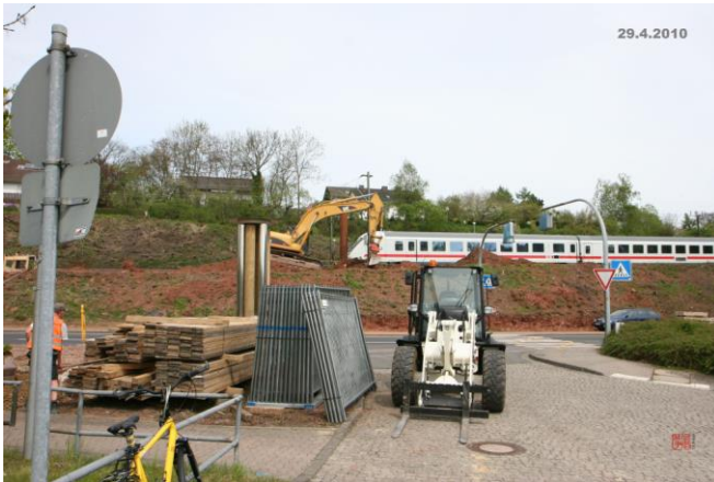
...der IC von und nach Dresden...