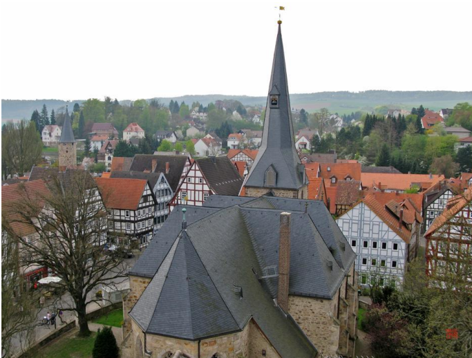
Stadtkirche von Osten gesehen (Im Hintergrund links der Eulenturm)

Teil: Über den Dächern von Melsungen unter Ordnungszahl: 1.6.2