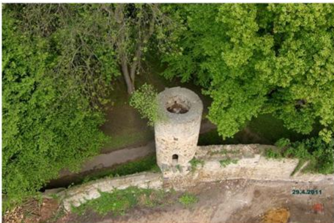
Turm am Schloßpark