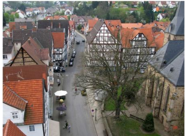
Fritzlärer Straße mit Stadtkirche