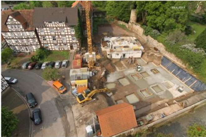
Fundamentierung der Wohnanlage links Vogteiplatz