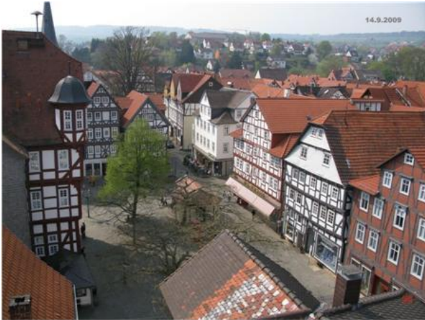
Rathaus mit Königsplatz