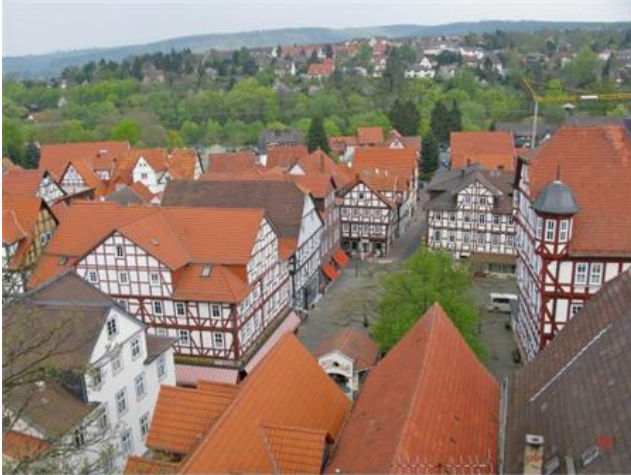
Rathaus mit Königsplatz Richtung Flämmergasse