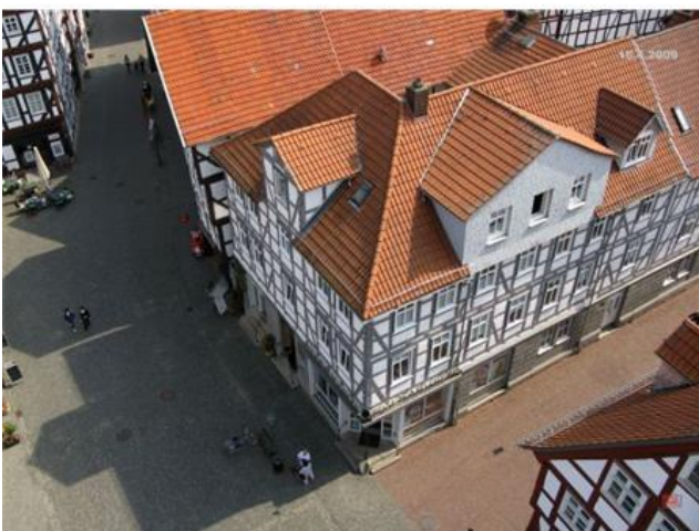
Burgstraße | Fritzlärer Straße