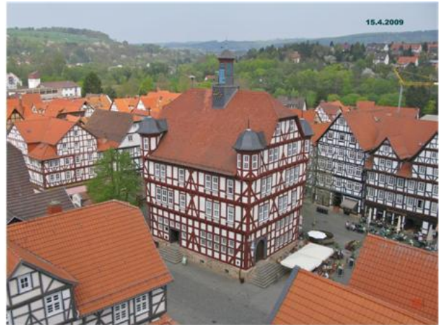
Rathaus mit Marktplatz