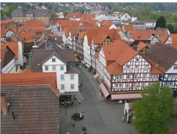
Marktplatz - Kasseler Straße – Richtung NORD Schloß