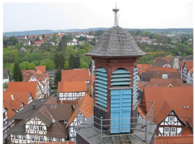
Rathausturm ohne Bartenwetzter Zurzeit macht er die Mittagspause...