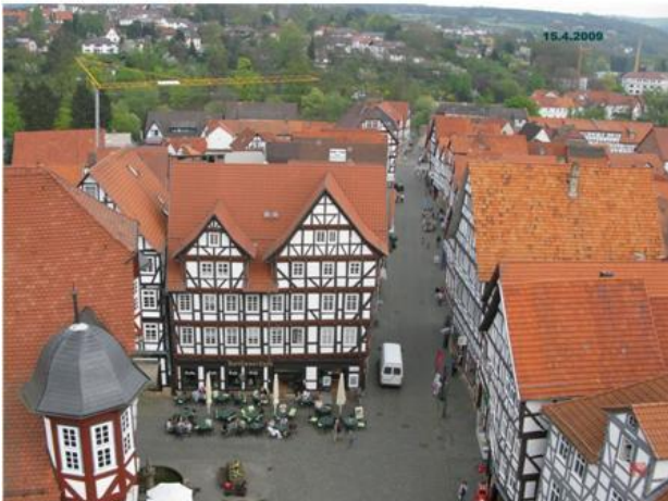
Marktplatz mit Brückenstraße