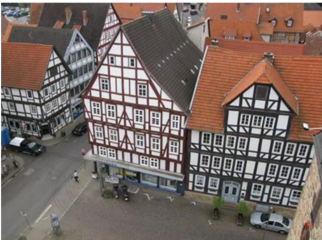
Burgstraße | Fritzlärer Straße