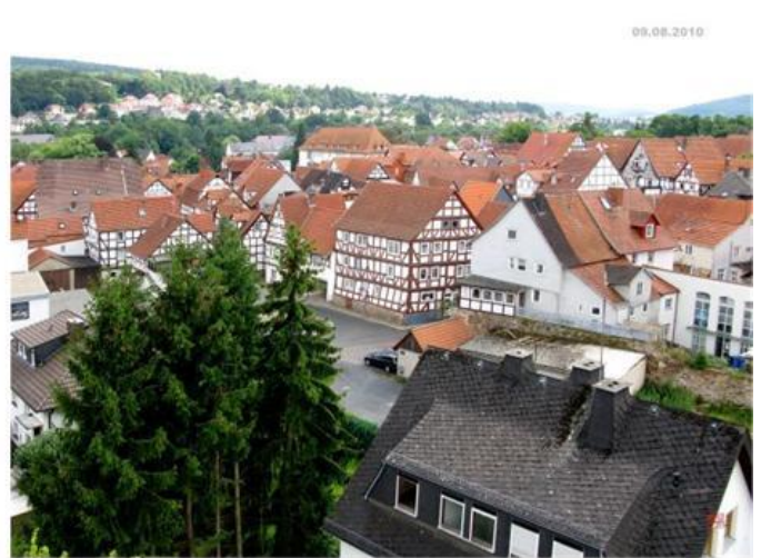
Blick Richtung Flämmergasse